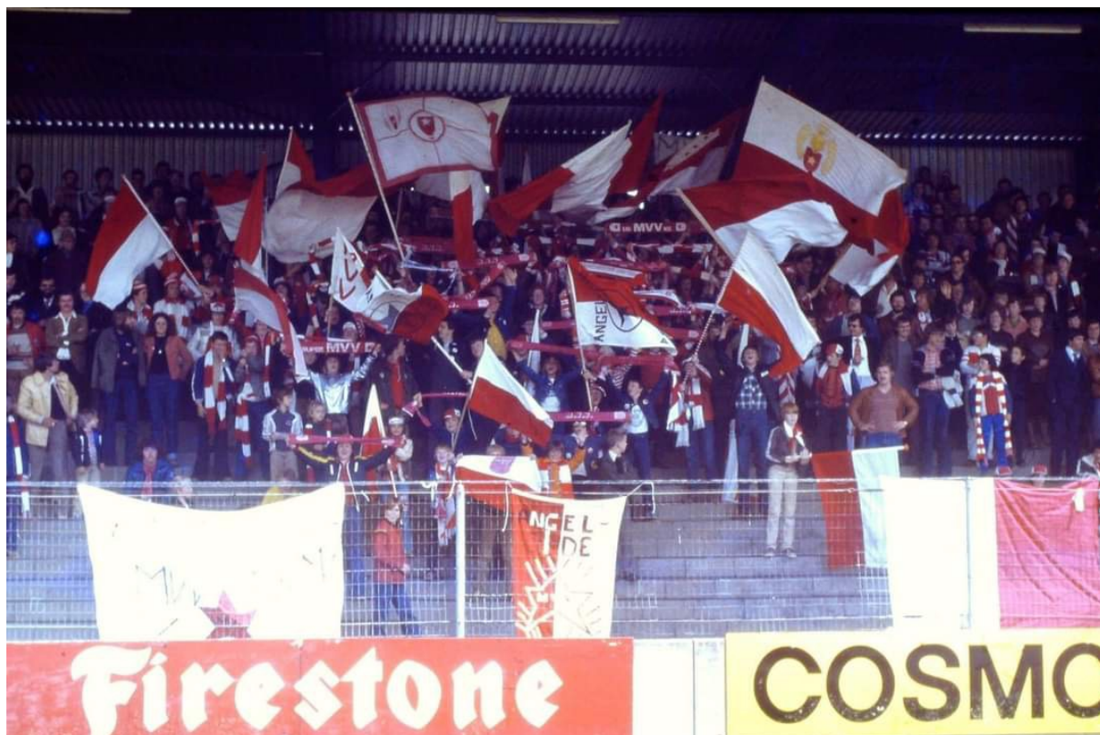
Angelside eind jaren zeventig van de vorige eeuw